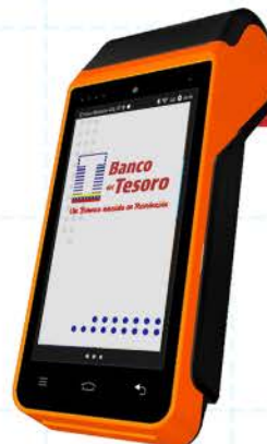
MODELO MF 919