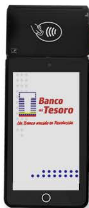
MODELO TOPWISE T1