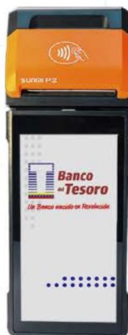
MODELO SUNMI P2 SMART